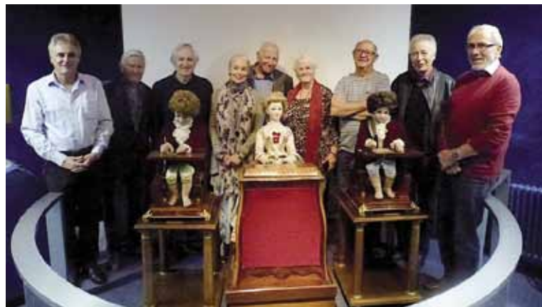
Quelques membres de l'AENJ lors de sa sortie d'automne (2 octobre 2015): visite des automates des Jaquet-Droz au Musée d'art et d'histoire à Neuchâtel.